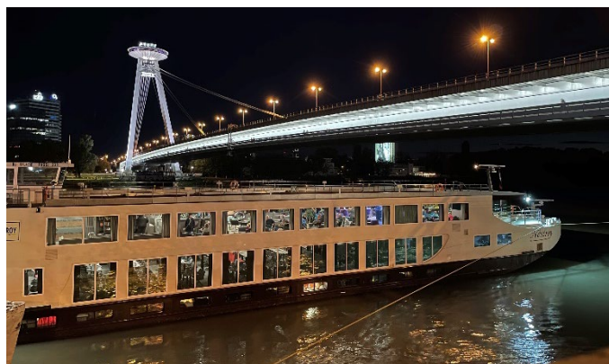
MS Nestroy abends in Bratislava

Preis: € 20,- pro Person (Vorausbuchung erforderlich). Bitte geben Sie uns zeitnah Bescheid, ob wir den Transfer für Sie buchen dürfen.