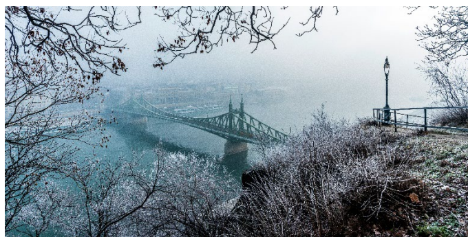
Adventmarkt in Bratislava

In der Früh erreicht wir Wien. Wir sagen der MS Nestroy Lebwohl und treten mit vielen schönen Erinnerungen im Gepäck die Heimreise an.