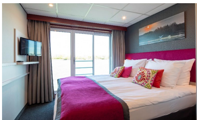
MS Nestroy, Doppelkabine Schiller- bzw. Goethedeck